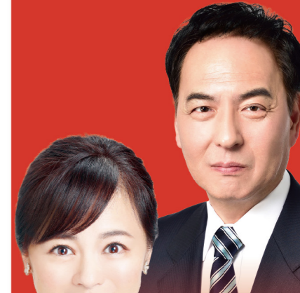
参議院議員 浅田均

今後も、生まれ育った地元枚方・交野の課題解決に向け、国・府・市と連携して力を尽くして取り組みます。