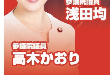
参議院議員 高木かおり

日本維新の会の浅田均、高木かおりの両参議院議員(大阪府選挙区)は、枚方市支部と交野市支部の大会及び報告会にそれぞれ出席し、今後の国政改革にける思いと、夏の決戦に向けた決意を述べました。