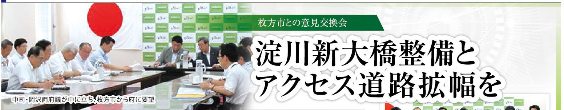
枚方市との意見交換会

を加速させることを目標に、○プラスチックごみ削減 ○大阪都構想の情報発信 ○消防の広域化と大阪消防庁の創設 ○水道の一元化 ○受動喫煙対策など合わせて42項目について施策の方向を示しています。