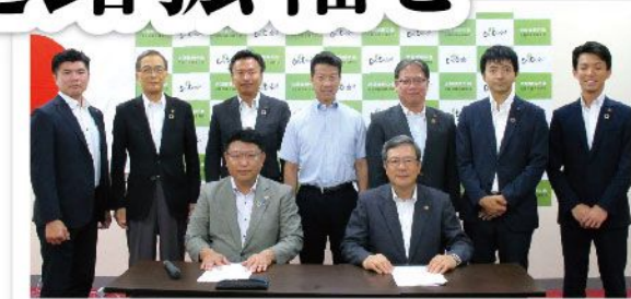
意見交換会の後、伏見市長・市議会議員団と

とくに淀川新大橋の整備に伴う交通量増加対策として必要な府道京都守口線等の府道拡幅や安全対策などについて、両府議が対応を強く求めました。今後も引き続き、府と枚方市とのパイプ役